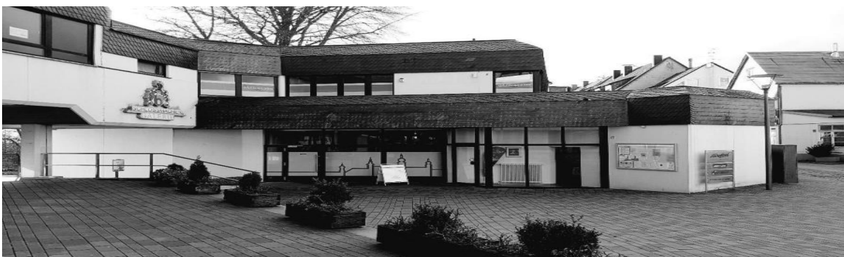
Haus der Begegnung am Schloßmacherplatz

An jedem dritten Mittwoch im Monat findet die Beratung auch im Bürgerzentrum Wupper (Siedlungsweg 24) statt.